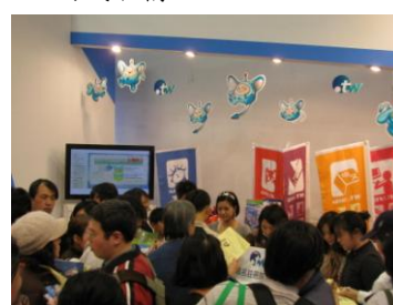
↑ 索取 yourname.idv.tw 體驗包的人潮