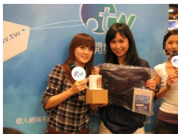
↑ 泡菜公主贈送自己繪製的馬克杯給現場民眾